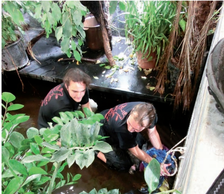
Fang eines gut zwei Meter langen Brillenkaimans in der üppig begrünten Krokodilanlage