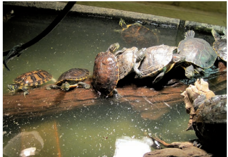
Das Wasserschildkrötenproblem

Würgeschlangen, Krokodile und Giftschlangen nicht aus. Viele Tiere sind aufgrund von Artenschutz, Krankheiten, ihrer Größe, ihrem Geschlecht oder ihrer Gefährlichkeit kaum vermittelbar. Derzeit befinden sich beispielsweise ca. 300 amerikanische Schmuckschildkröten, ca. 100 Riesenschlangen, 15 herpespositive Landschildkröten sowie etwa weitere 50 Landschildkrötenmännchen in der Auffangstation. Die Suche nach anderen Räumlichkeiten gestaltet sich schwierig: Niemand möchte Reptilien in seiner Nachbarschaft haben.