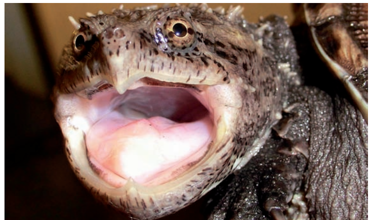
Eine von ca. 15 momentan zu pflegenden Chelydra serpentina

Würgeschlangen, Krokodile und Giftschlangen nicht aus. Viele Tiere sind aufgrund von Artenschutz, Krankheiten, ihrer Größe, ihrem Geschlecht oder ihrer Gefährlichkeit kaum vermittelbar. Derzeit befinden sich beispielsweise ca. 300 amerikanische Schmuckschildkröten, ca. 100 Riesenschlangen, 15 herpespositive Landschildkröten sowie etwa weitere 50 Landschildkrötenmännchen in der Auffangstation. Die Suche nach anderen Räumlichkeiten gestaltet sich schwierig: Niemand möchte Reptilien in seiner Nachbarschaft haben.