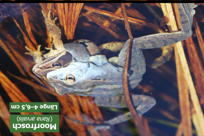
Moorfrosch ( Rana arvalis ) Länge 4–6,5 cm