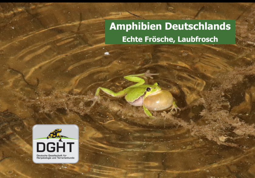
Amphibien Deutschlands Echte Frösche, Laubfrosch