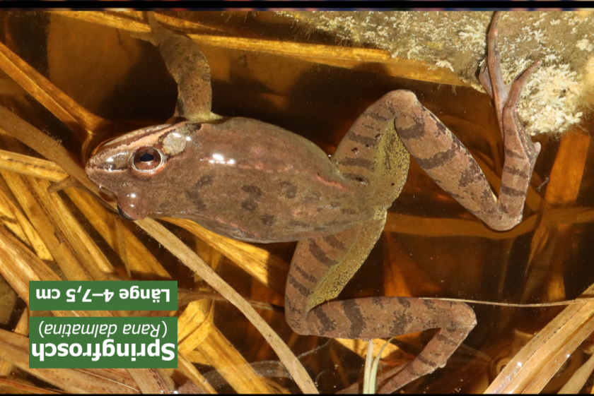
Springfrosch ( Rana dalmatina ) Länge 4–7,5 cm