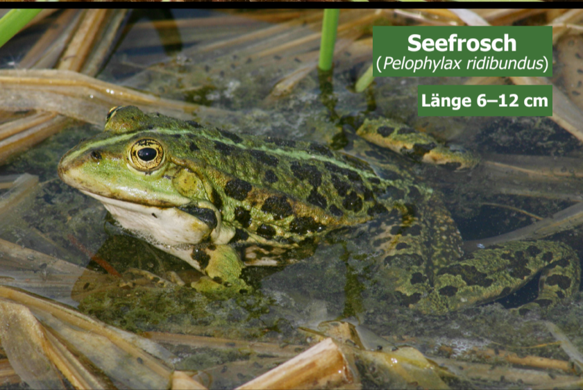
Seefrosch ( Pelophylax ridibundus )