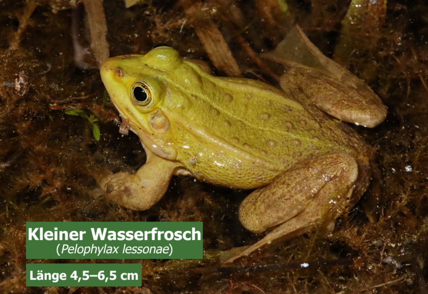
Kleiner Wasserfrosch ( Pelophylax lessonae )