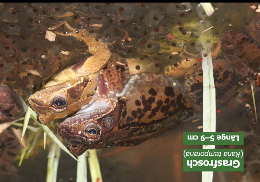
Grasfrosch ( Rana temporaria ) Länge 5–9 cm