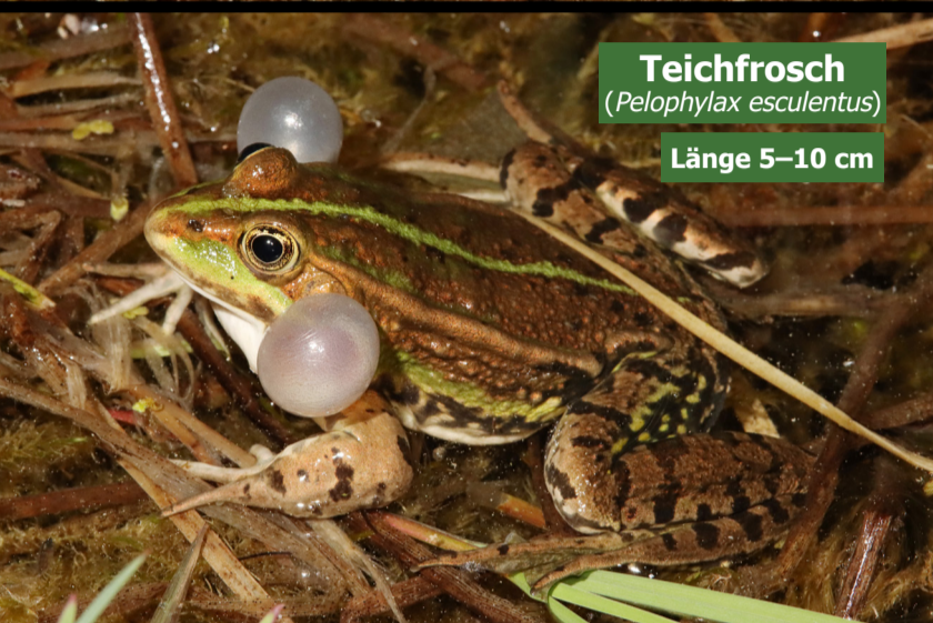
Teichfrosch ( Pelophylax esculentus )