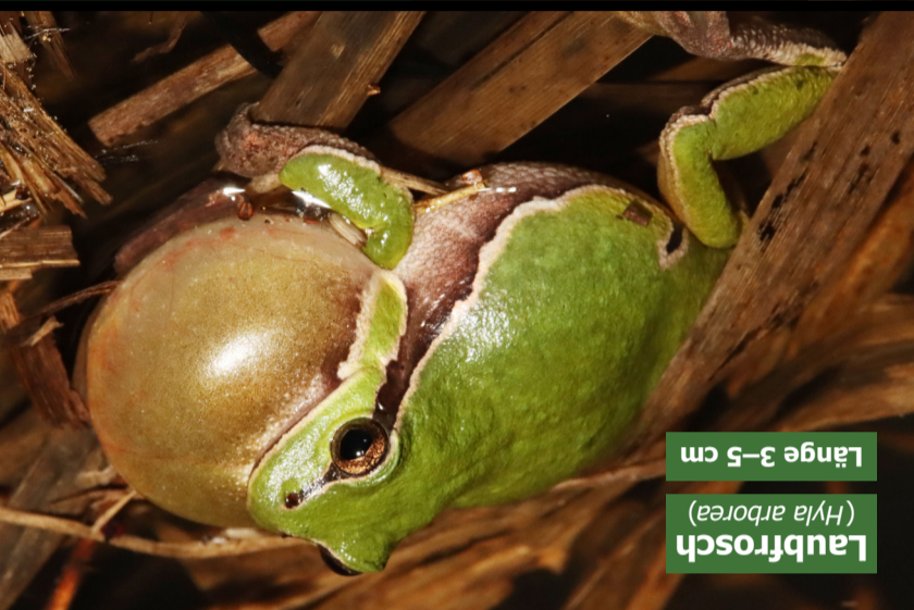
Laubfrosch ( Hyla arborea ) Länge 3–5 cm

IMPRESSUM - DGHT Deutsche Gesellschaft für Herpeto- logie und Terraristik e. V. Vogelsang 27 D-31020 Salzhemmendorf E-Mail: gs@dght.de Fotos, Redaktion und Layout: Dr. Axel Kwet / DGHT e. V. Weitere Informationen: www.dght.de www.salamandra-journal.com https://feldherpetologie.de